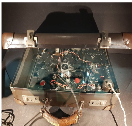
Poste émetteur clandestin.