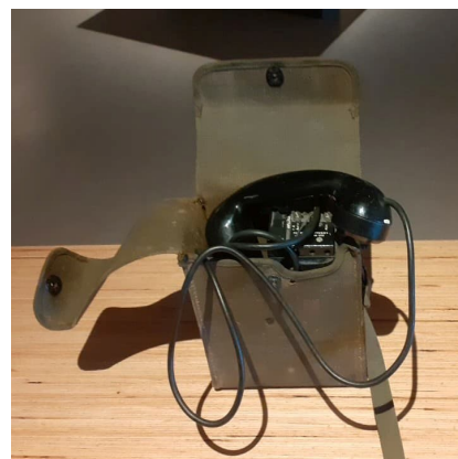
Téléphone de campagne.