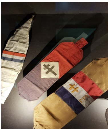
Brassards FFI