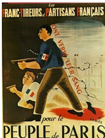
Affiche Résistance Française