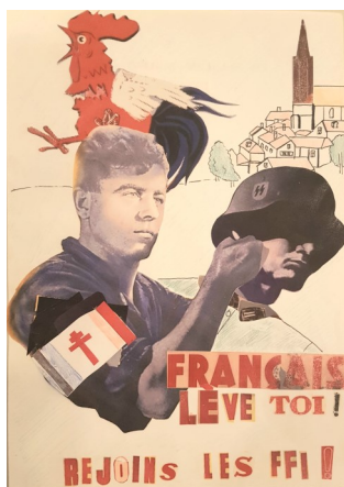
Création lors d'un atelier