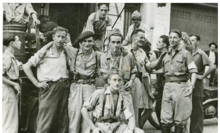
Libération d'Hyères par le maquis Vallier