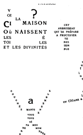
Calligrammes, Guillaume Apollinaire